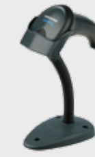
▪ STD-QWG20–BK Гибкая подставка, чёрная