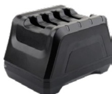
4-х зарядная станция для батарей