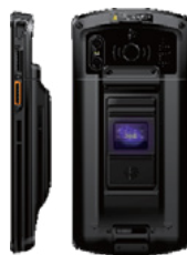
Фингерпринт - версия